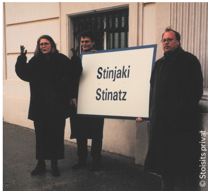
Die zweisprachige Ortstafel von Stinjaki/Stinatz