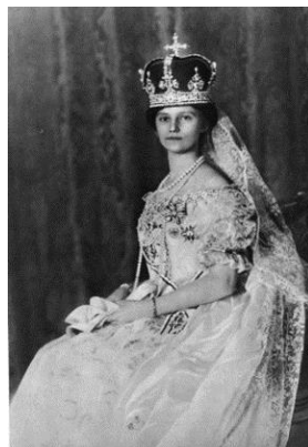
Zita von Bourbon-Parma