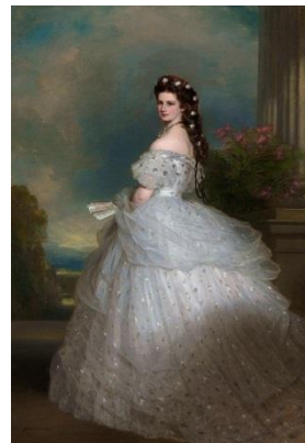
Elisabeth von Österreich – Ungarn