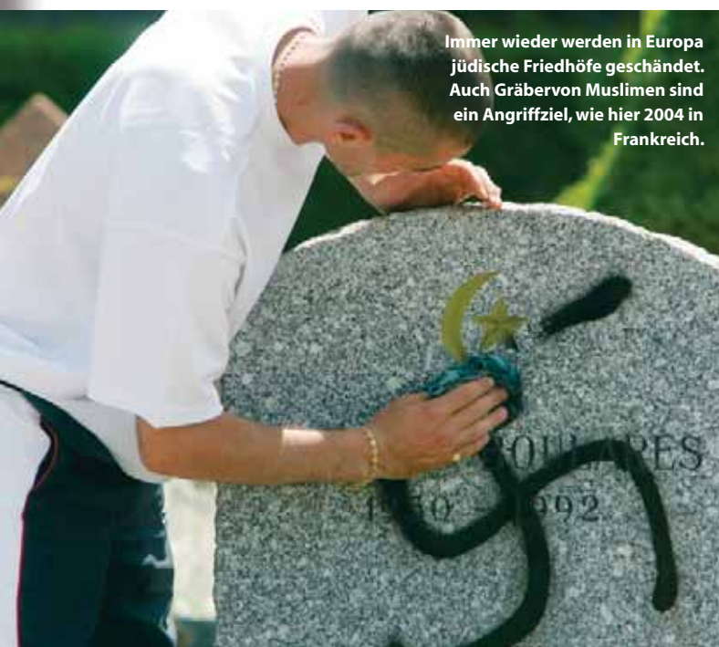
Immer wieder werden in Europa jüdische Friedhöfe geschändet. Auch Gräber von Muslimen sind ein Angriffsziel, wie hier 2004 in Frankreich.

Das Fritz Bauer Institut in Frankfurt am Main ist an der Johann Wolfgang Goethe-Universität angesiedelt. Es erforscht die Geschichte und Wirkung der nationalsozialistischen Massenverbrechen, insbesondere des Holocaust und vermittelt die Ergebnisse in eine breite Öffentlichkeit. Dabei versteht sich das Institut als Scharnierstelle zwischen wissenschaftlicher Theoriebildung und kultureller Praxis. Informationen siehe www.fritz-bauer-institut.de