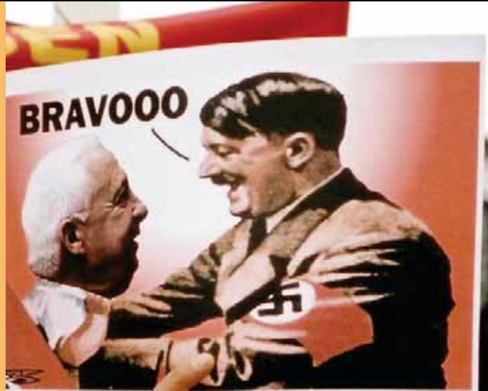
Plakat auf einer pro-palästinensischen Demonstration in Berlin, 2002.

Im November 2003 zerstörten Autobomben zwei Synagogen in Istanbul; mehr als 20 Menschen wurden getötet und 300 verletzt. In Deutschland wie in anderen Ländern gibt es pro-palästinensische, gegen Israel gerichtete Demonstrationen. Bei einer solchen Veranstaltung in Berlin trugen Demonstranten Transparente mit Parolen, die Aktionen der israelischen Regierung in den besetzten Gebieten mit dem Holocaust verglichen oder Plakate, auf denen Sharon, zu jener Zeit Israels Ministerpräsident, als Hitler dargestellt war. Ist das nun Kritik an Israel oder ist es Antisemitismus? Oder vielleicht beides? Israel steht im Zentrum der öffentlichen Aufmerksamkeit. Der Nahostkonflikt ist viel stärker präsent als andere Konflikte, wie zum Beispiel der Bürgerkrieg im Kongo oder die Gewalt in Darfur, Tschetschenien, oder Nepal. Keinem anderen Staat wird mit der Kritik an seiner Politik das Existenzrecht abgesprochen. Auch wenn man den Krieg im Irak heftig kritisiert, spricht man doch nicht den USA, Großbritannien und all den Ländern, die daran beteiligt sind, das Recht ab, als Staat zu existieren.