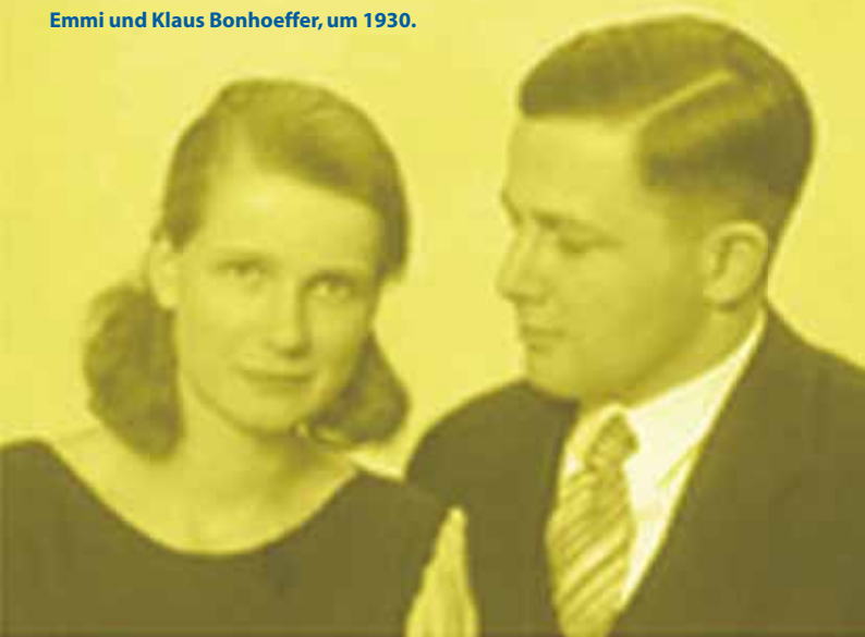
Emmi und Klaus Bonhoeffer, um 1930.

1. Was wurde nach 1945 unternommen, um die nationalsozialistischen Verbrechen zu bestrafen und Völkermorde in Zukunft zu verhindern? Erstelle eine Liste der auf dieser Seite vorgestellten Ereignisse und ergänze diese Liste aus deinem Wissen.