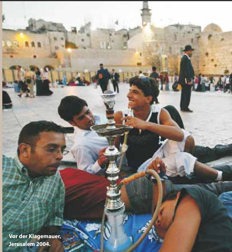
Vor der Klagemauer, Jerusalem 2004.

Seit Ende des Ersten Weltkrieges wurde Palästina von einer britischen Mandatsregierung verwaltet. Die Mandatsregierung machte sowohl Juden als auch palästinensischen Arabern Hoffnungen auf einen unabhängigen Staat. Juden kauften Land von arabischen Großgrundbesitzern. Als in Europa die Gewalt gegen Juden zunahm, stieg die Zahl der jüdischen Immigranten auf 300.000. Nach dem Holocaust kam es erneut zu einer Einwanderungswelle. Die Konflikte zwischen Arabern, Juden und der britischen Mandatsregierung verschärfen sich. Im November 1947 beschlossen die Vereinten