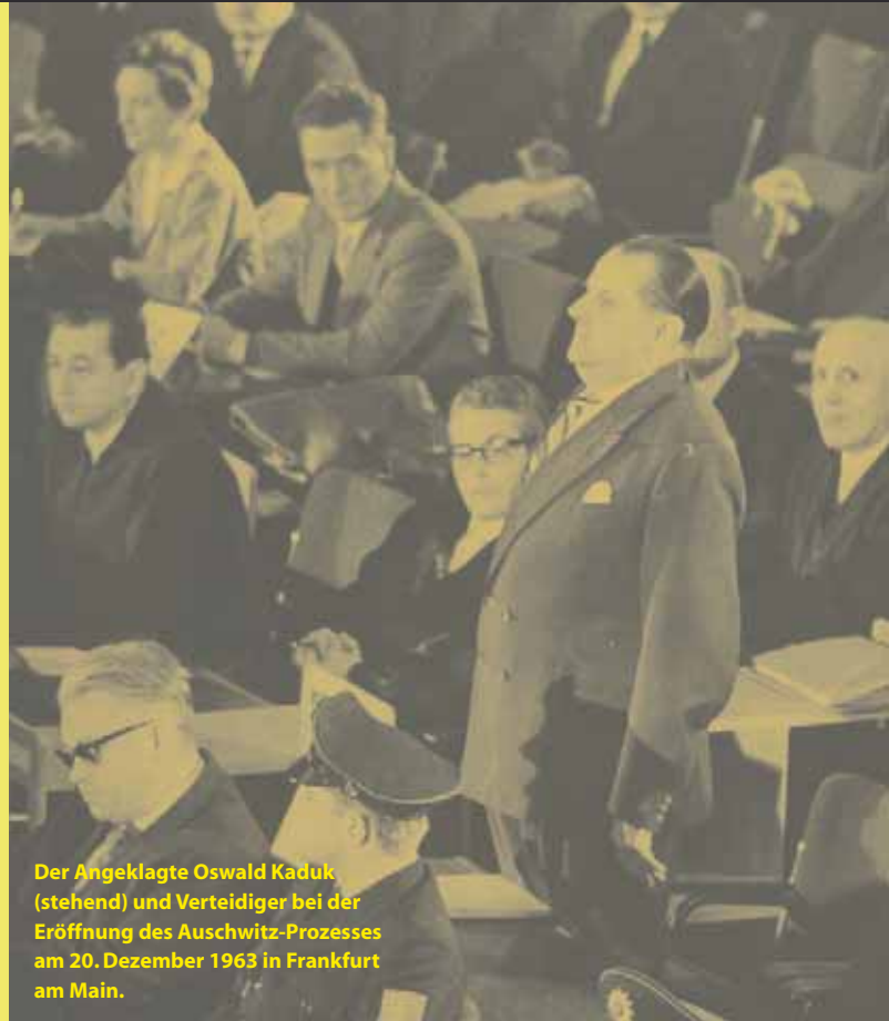
Der Angeklagte Oswald Kaduk (stehend) und Verteidiger bei der Eröffnung des Auschwitz-Prozesses am 20. Dezember 1963 in Frankfurt am Main.

Als Reaktion auf diese Prozesse entstand der Plan, einen internationalen Strafgerichtshof ( Tribunal ) zu schaffen, der sich speziell mit Delikten wie Völkermord und Verbrechen gegen die Menschlichkeit befassen sollte. Die Spannungen zwischen den USA und der Sowjetunion verhinderten jedoch eine rasche Umsetzung dieses Plans. Erst nach dem Ende des Kalten Krieges war es möglich, internationale Gerichtshöfe für Verbrechen gegen die Menschlichkeit und Völkermord einzusetzen. 1993 wurde ein Tribunal gegen die Verantwortlichen im früheren Jugoslawien eingesetzt, 1994 kam ein weiteres für Ruanda dazu. Im Juli 2002 wurde der Internationale Strafgerichtshof in Den Haag offiziell konstituiert.