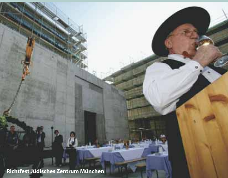
Richtfest Jüdisches Zentrum München

Im Herbst 2005 wurde in München das Richtfest für das neue Jüdische Zentrum gefeiert. Zwei Jahre zuvor war es der Polizei gelungen, einen Anschlag auf die künftige Kultur- und Begegnungsstätte zu verhindern. Eine Neonazi-Gruppe hatte bereits eine große Menge Sprengstoff gelagert und Pläne für ein Attentat während des Festaktes zur Grundsteinlegung geschmiedet. Die Polizei verhaftete 14 Personen. Manche der Angeklagten bereuten während des Verfahrens ihre Mitgliedschaft in der Gruppe. Der Anführer schrieb jedoch in einem Brief aus dem Gefängnis: „Ich werde erst Ruhe finden, wenn der Endsieg errungen ist.“ Die Grundsteinlegung und die Einweihung der Synagoge am 9. November 2006 verliefen ohne Zwischenfälle.