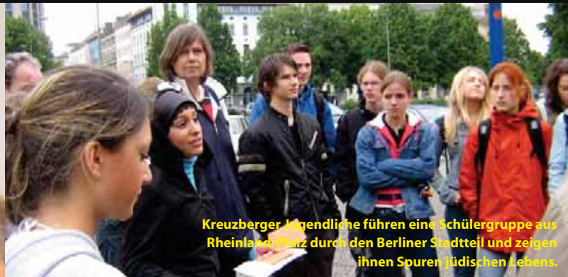
Kreuzberger Jugendliche führen eine Schülergruppe aus Rheinland-Pfalz durch den Berliner Stadtteil und zeigen ihnen Spuren jüdischen Lebens.