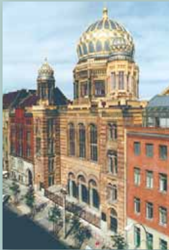
50 Jahre nach Kriegsende wurde die Neue Synagoge in der Oranienburger Straße in Berlin als Centrum Judaicum eröffnet.

Nach 1945 versuchten die wenigen Juden, die den Massenmord überlebt hatten und nicht emigriert waren, sich eine neue Existenz in Europa aufzubauen. Mit der Zeit entwickelten sich an manchen Orten wieder jüdische Kultur und jüdisches Leben. Jüdische Gemeinden wurden neu gegründet und Synagogen geweiht. Gleichzeitig waren Juden in Europa mit neuen Formen von Antisemitismus konfrontiert. Die Leugnung der Schoah oder ihre Verharmlosung sind weit verbreitete Beispiele.