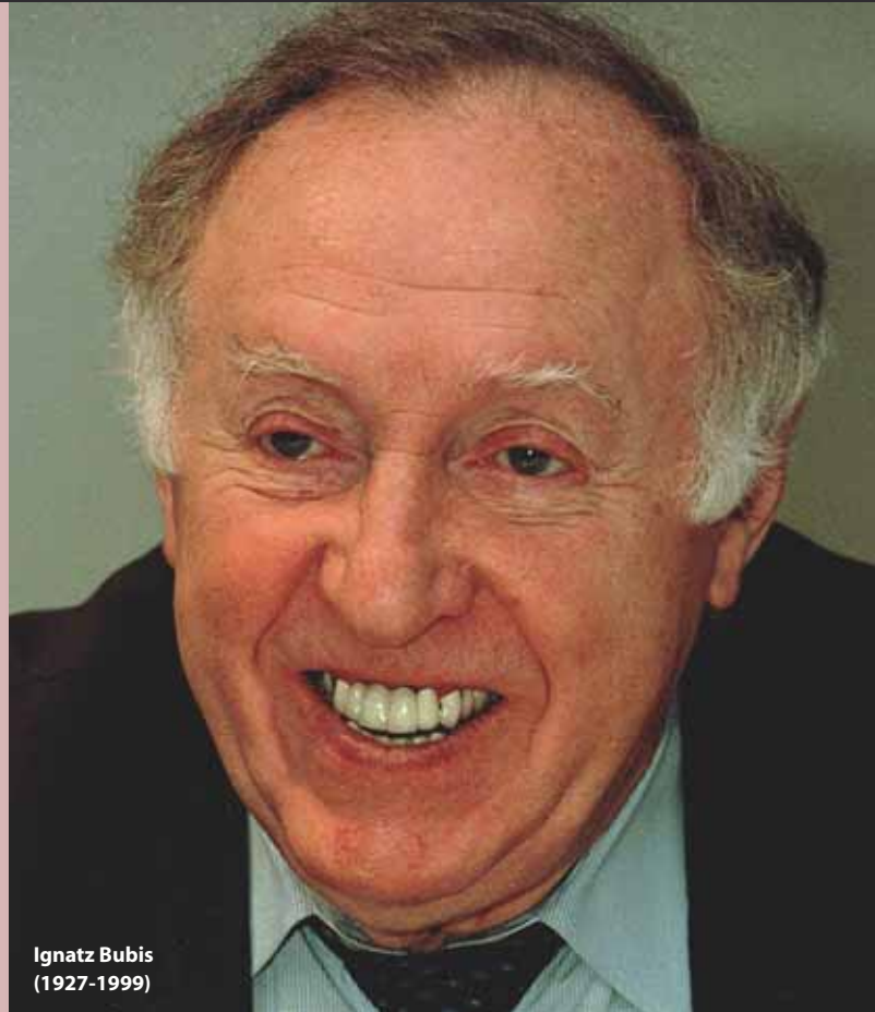
Ignatz Bubis (1927-1999)

Mit einem Freund zusammen verließ Ignatz Bubis Polen. Nichts war ihm dort mehr geblieben. Er zog zu seinem Onkel nach Berlin, in ein Lager, das für Überlebende eingerichtet worden war, um von dort auszuwandern. „Nach ungefähr drei Tagen überkam mich jedoch der Gedanke: ‚Jetzt bist du schon wieder im Lager!‘ Ich konnte nach all den Jahren nicht mehr hinter Stacheldraht schlafen. Ich war hungrig nach Leben, hungrig nach Selbstständigkeit, vielleicht auch hungrig nach Wohlstand. Unabhängigkeit war besonders erstrebenswert.“