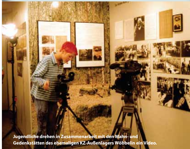
Jugendliche drehen in Zusammenarbeit mit den Mahn- und Gedenkstätten des ehemaligen KZ-Außenlagers Wöbbelin ein Video.