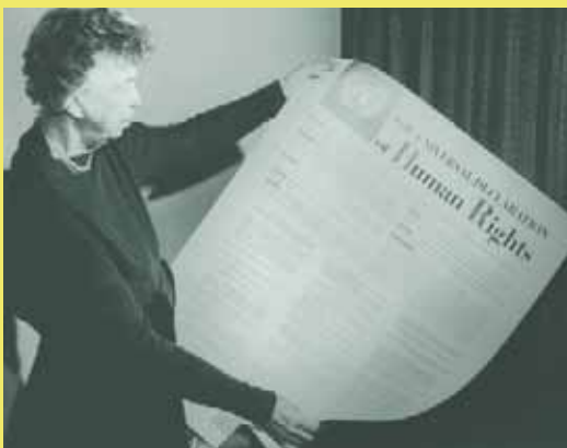
Eleanor Roosevelt spielte eine wichtige Rolle bei der Entstehung der Allgemeinen Erklärung der Menschenrechte. Sie war die Frau des amerikanischen Präsidenten Franklin D. Roosevelt, der 1945 starb. Eleanor Roosevelt vertrat die USA in den neu gegründeten Vereinten Nationen.

Mit dem Prozess wurde das lange Schweigen über die NS-Verbrechen in der Nachkriegszeit durchbrochen. Doch schon damals gab es Stimmen, die einen „Schlussstrich“ forderten.