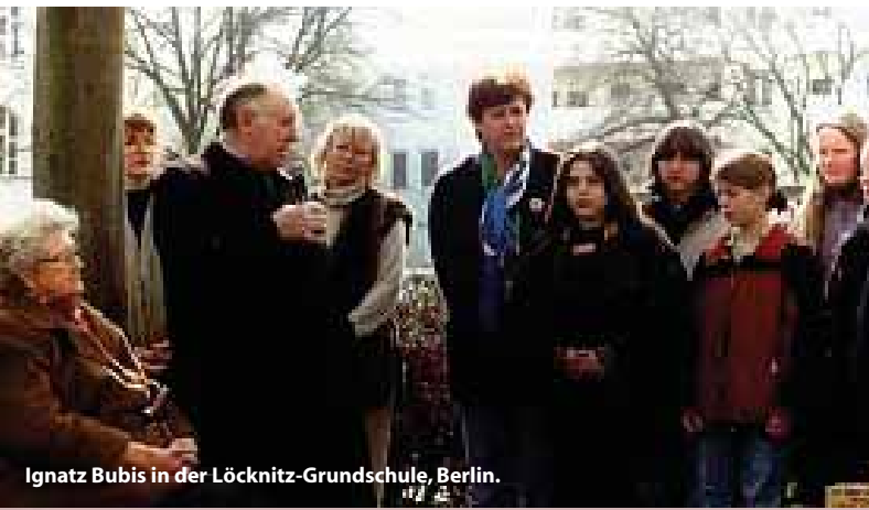
Ignatz Bubis in der Löcknitz-Grundschule, Berlin.