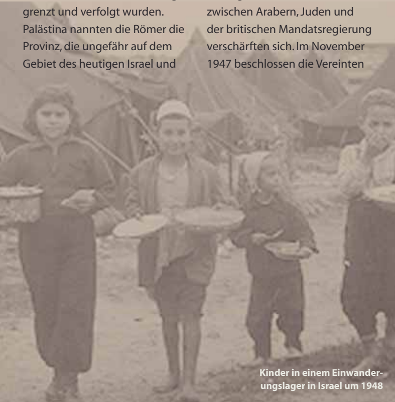
Kinder in einem Einwanderungslager in Israel um 1948

Kriege arabischer Staaten gegen Israel hatten unmittelbare Folgen für Juden in anderen Teilen der Welt. Nach Verfolgung und Übergriffen in Ägypten, Libyen, dem Jemen, Irak, Marokko und Äthiopien verließ ein Großteil der dort lebenden Juden ihre bisherige Heimat und immigrierte nach Israel. 1948 lebten eine Million Juden in Nordafrika und anderen Ländern des Nahen Ostens. In den folgenden Jahrzehnten sank ihre Zahl auf 30.000 bis 40.000. Seit 1989 kommen viele Juden aus der ehemaligen Sowjetunion. 1991 wurden innerhalb von 36 Stunden 14.000 Juden aus Äthiopien nach Israel ausgeflogen. Heute leben Juden aus über 100 Ländern in Israel.