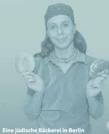
Eine jüdische Bäckerei in Berlin

vor der Realität und verfolgen in der Regel damit die Absicht, Täter zu Opfern zu machen und das Gedenken an die jüdischen Opfer auszulöschen. In vielen europäischen Ländern ist die Leugnung des Holocaust ein Straftatbestand. Aber nicht nur unter Neonazis entstand ein neuer Antisemitismus nach Auschwitz. Der Vorwurf, Juden zögen Vorteile aus ihrer Verfolgungsgeschichte, und die Forderung nach einem Schlussstrich unter die Vergangenheit begleiten die Geschichte der Bundesrepublik seit ihrer Gründung. Dieser Antisemitismus nach Auschwitz ist eng mit der Erinnerung an die Schoah verbunden und dient dazu, einer eigenen Auseinandersetzung mit der NS-Rassenpolitik und ihren Folgen aus dem Weg zu gehen.