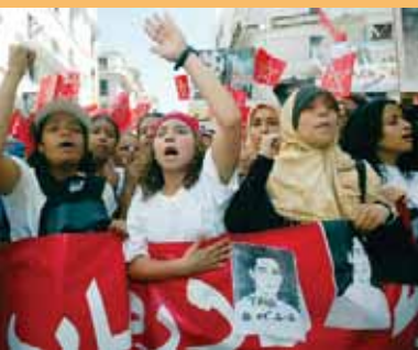
Demonstration nach einem Bombenanschlag auf ein jüdisches Gemeindezentrum in Casablanca 2003. Hunderte Marokkaner protestieren öffentlich gegen die Gewalt gegen jüdische Einrichtungen.

Kritik an Israel und der Politik seiner Regierung ist nicht immer ein Ausdruck von Antisemitismus. Jeder kann seine Meinung dazu äußern. Dies geschieht auch in zahlreichen Diskussionen und in den Medien. Die Kritik wird dann antisemitisch, wenn sie Vorurteile gegenüber Juden verwendet oder zum Hass auf Juden anstatt, wenn sie an Israel andere Maßstäbe ansetzt als an andere Staaten in der Welt, wenn sie das Vorgehen der israelischen Armee mit dem Holocaust vergleicht. Häufig wird die Kritik genutzt, um antisemitische Vorurteile verdeckt zu äußern.